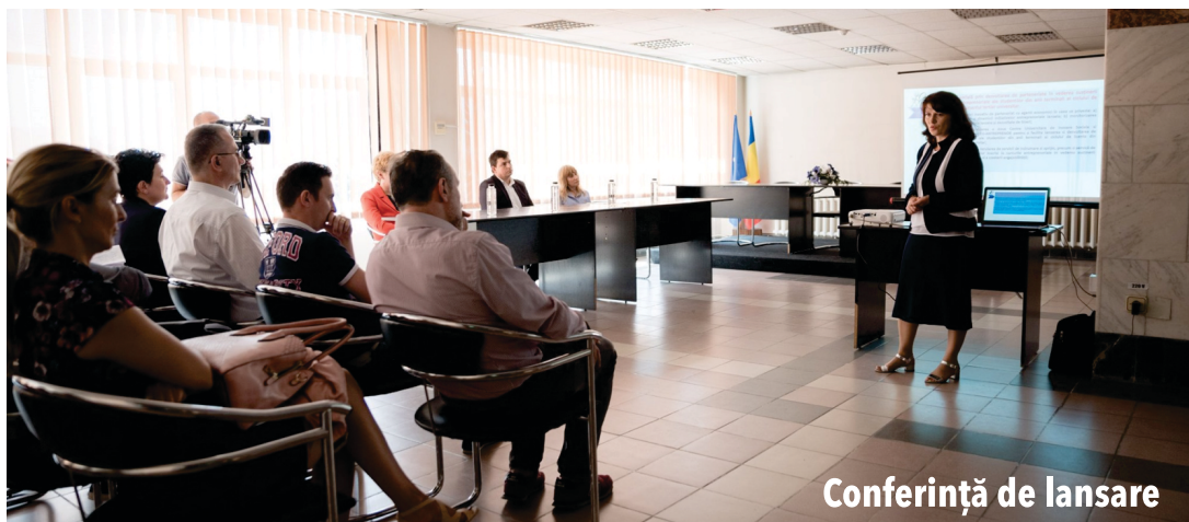
Conferință de lansare

Având în vedere că în proiect vor participa studenți din anii terminali ai ciclului de licență, personal didactic, elevi de liceu și agenți economici care vor fi implicați în activități specifice proiectului, ca de exemplu cursuri complementare, ateliere antreprenoriale, stagii de pregătire practică, caravane de promovare a ofertei educaționale, proiectul se vrea a avea efecte pozitive asupra mediului de învățare din universitate cât și un efect direct și stimulator pentru mediul de afaceri.